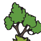
Arbres de haut jet